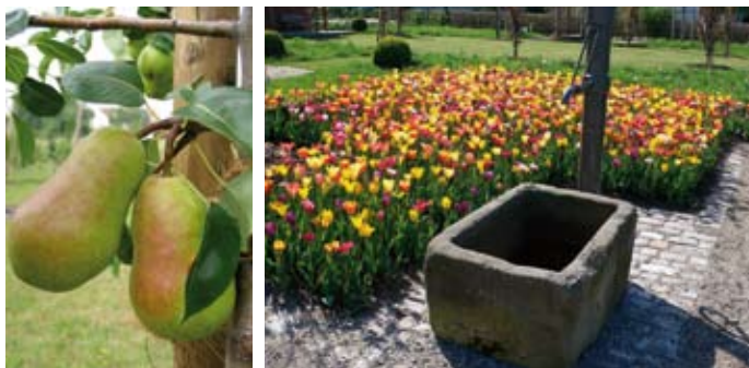
Ausschnitt Birnenbaum: Frühe aus Trevoux, Brunnenrog im Bauerngarten

Der Maurische Garten ist Keimzelle und Herzstück des Obstgartens, aber auch der Buchenhain, ein Bauerngarten, ein Kräuter- und ein Schulgarten warten darauf entdeckt zu werden. Dank der vielfältigen Blumenbeete und Wiesenflächen ist der gesamte Obstgarten zudem ein großer Vogel- und Insektengarten.