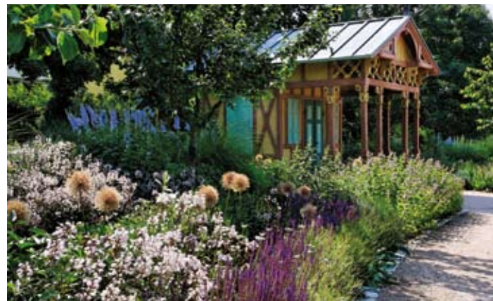
Gartenhaus aus der Gründerzeit

Von Ende Mai bis Anfang September hat der Obstgarten zudem an jedem Wochenende weitere Angebote für seine Besucher: das Pestalozzi Café, Floristik im Hofladen und ein Gartenkulturprogramm.