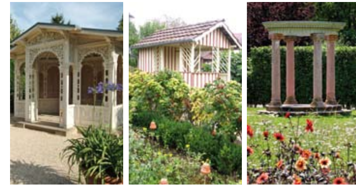
Pavillon im maurischen Stil, Kleingärtnerlaube, kleiner Tempel

Mit dem Roten Gartenhaus, erbaut um 1900, und dem Pavillon im maurischen Stil von 1877, beginnt 1998 der Aufbau einer einzigartigen Sammlung von historischen Gartenhäusern und Lauben.